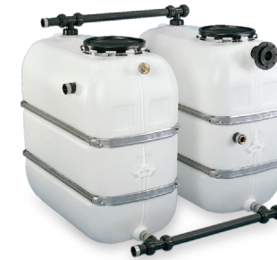
1100 L Pufferspeicher

Sonderausstattung: - Überlauf - Mannloch - Stutzen - Verbindungsleitung