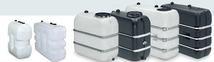
800-2500 L ohne Profilbandagen