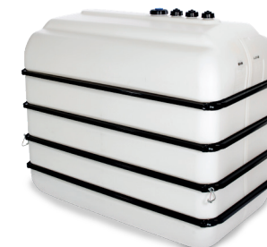
5000L mit pulverbeschichteten Bandagen für AdBlue®